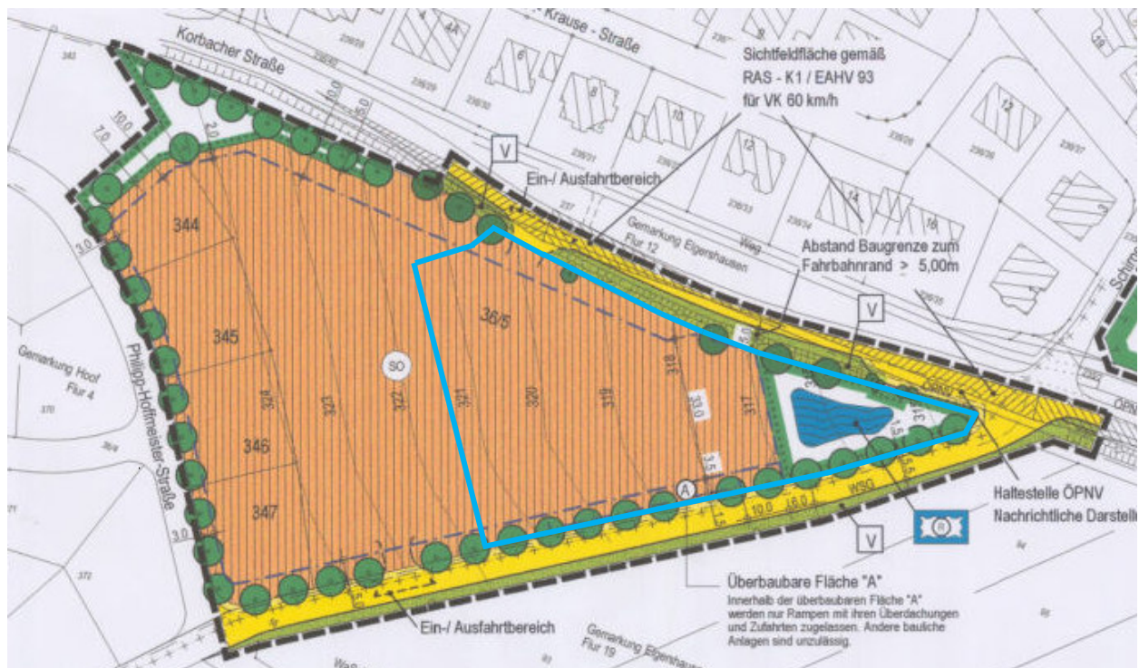
Abbildung: Geltungsbereich zum Bebauungsplanes Nr. 51 „SO - Einzelhandel Hoof“ und Geltungsbereich der 2. Änderung zum B-Plan Nr. 51

Bei dem Planänderungsgebiet handelt sich um ein etwa 0,52 ha großes Einzelgrundstück am südöstlichen Siedlungsrand des Schauenburger Ortsteiles Hoof. Die Fläche liegt innerhalb des „Sondergebietes (SO) – Einzelhandel Hoof“ (§ 11 BauNVO), das auf Grundlage des Bebauungsplanes Nr. 51 (rechtskräftig seit 10.03.2006) als Standort für Lebensmittelmärkte entwickelt worden war. Seither werden die Flächen in diesem Sinne genutzt. Angesiedelt sind ein REWE- und ein ALDI-Markt. Die aktuelle Situation stellt sich wie folgt dar: