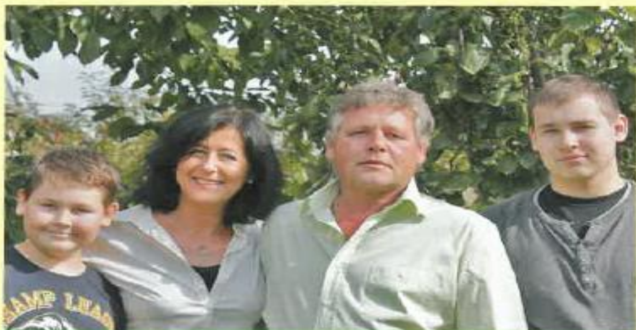
Familie Keßler freut sich auf Ihren Besuch.